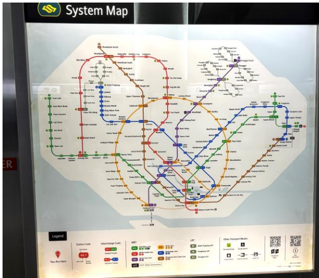
シンガポールの地下鉄網