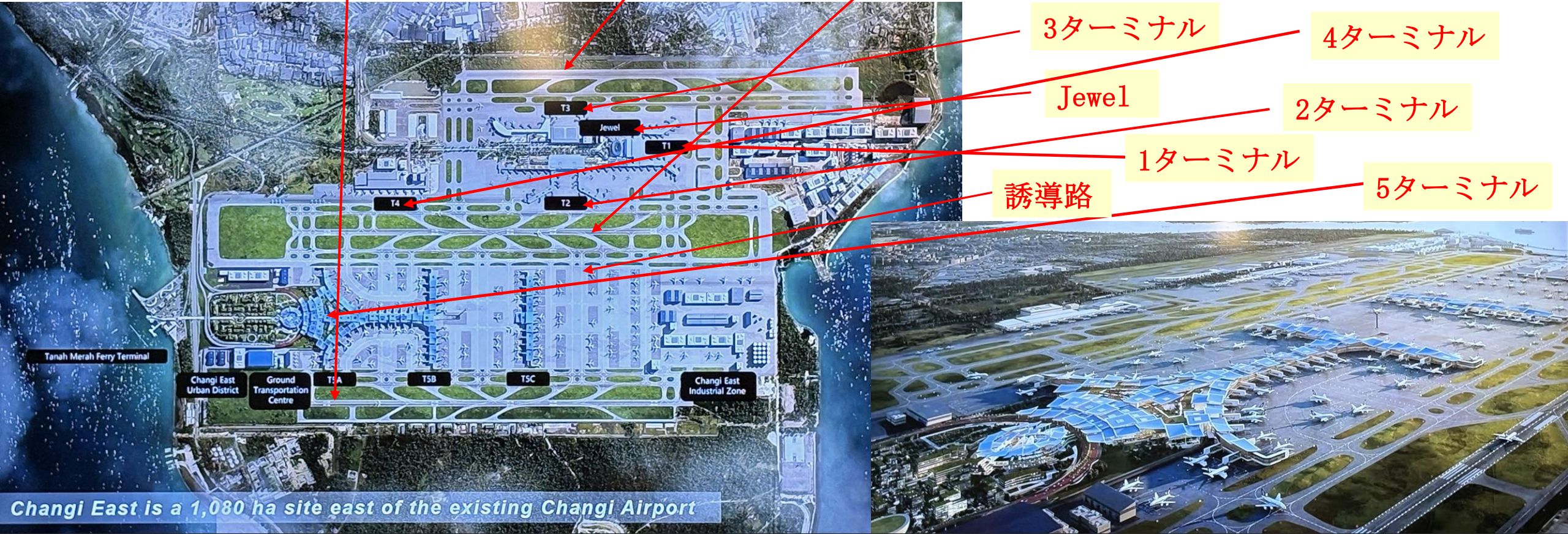
Changi East is a 1,080 ha site east of the existing Changi Airport

○2025年春から建設が始まる第5ターミナルは、下図の通り第1滑走路「02L/20R」と第2滑走路「02C/20C」より約1.8キロメートル東に離れた第3滑走路「02R/20L」の付近に建設される予定となっています。(3本共に4,000m滑走路) ○2025年から新たに建設される5ターミナル計画がいかに大きいか分かります。成田の第3滑走路建設を含む機能強化策も新たに1,000haに及ぶ拡張を計画していますが、それと同じ以上の規模であり、但し圧倒的に違うのが、もう既に第3滑走路は完成していることであります。新たなターミナルのゲート数を見ると1タ,2タ,3タ,を遥かに凌ぐ数になると予想されます。極最近に発表された世界の空港の中で食に関する魅力度を調査した結果を見ると、やはりチャンギー空港がNo.1に輝いており、(因みにベスト5中に羽田・成田も選出されています。)今後も、世界の中のNo.1の空港として君臨することは確かだと思われす。成田国際空港もどの様にして世界から魅力的な空港として評価を受けられるか、真剣に論議することが必要と感じました。