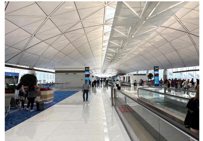
香港国際空港の第1ターミナル